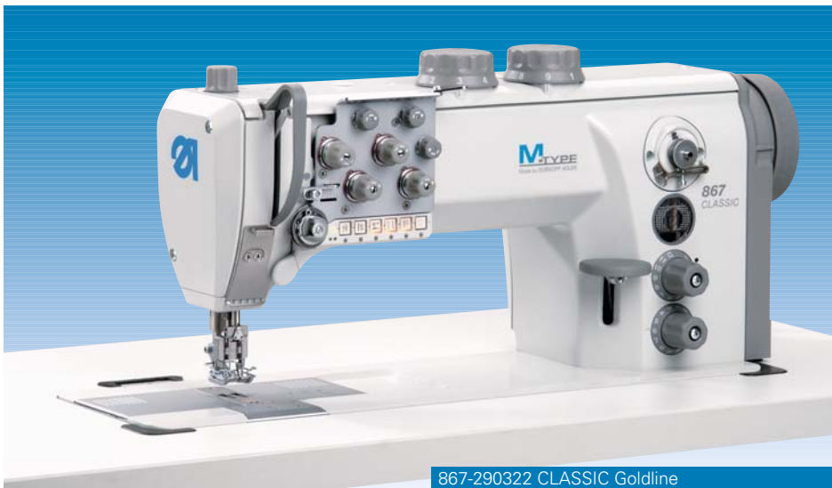
867-290322 CLASSIC Goldline