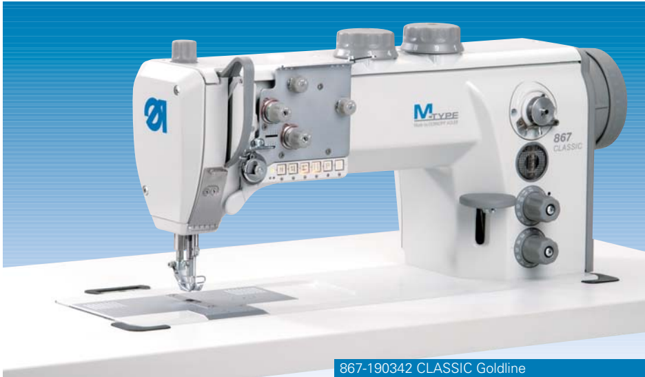
867-190342 CLASSIC Goldline

M-TYPE 867 CLASSIC Goldline – les sous-classes très puissantes