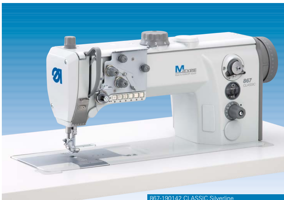
867-190142 CLASSIC Silverline

867-190142 CLASSIC Silverline La machine à base plate, point noué et une aiguille avec entraînement triple est équipée d'un lève-pied automatique, d'une course d'élévation réglable par roue de réglage, des points d'arrêts automatiques, d'un coupe-fil et d'un gros crochet type XXL à axe vertical. Grâce à la canette dont la capacité a été augmentée de 70%, le nombre des changements de canette se réduit presque de moitié.